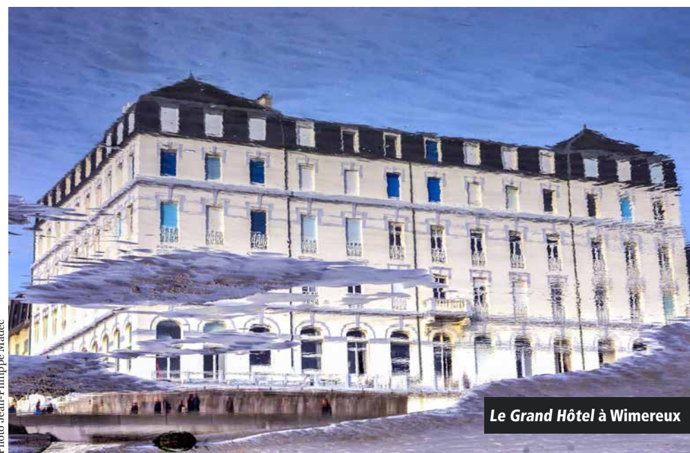
Le Grand Hôtel à Wimereux