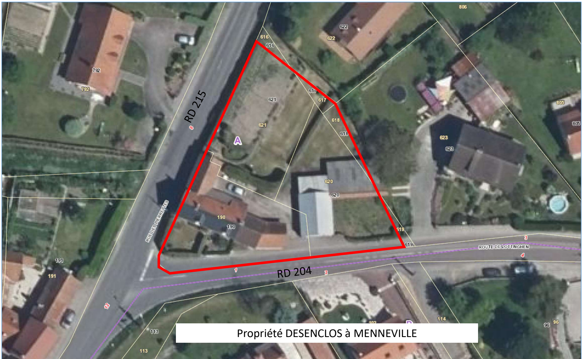
Propriété DEENCLOS à MENNEVILLE