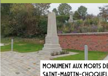
MONUMENT AUX MORTS DE SAINT-MARTIN-CHOQUEL