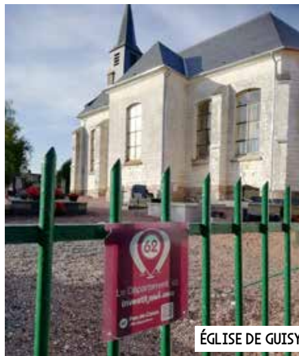
ÉGLISE DE GUISY