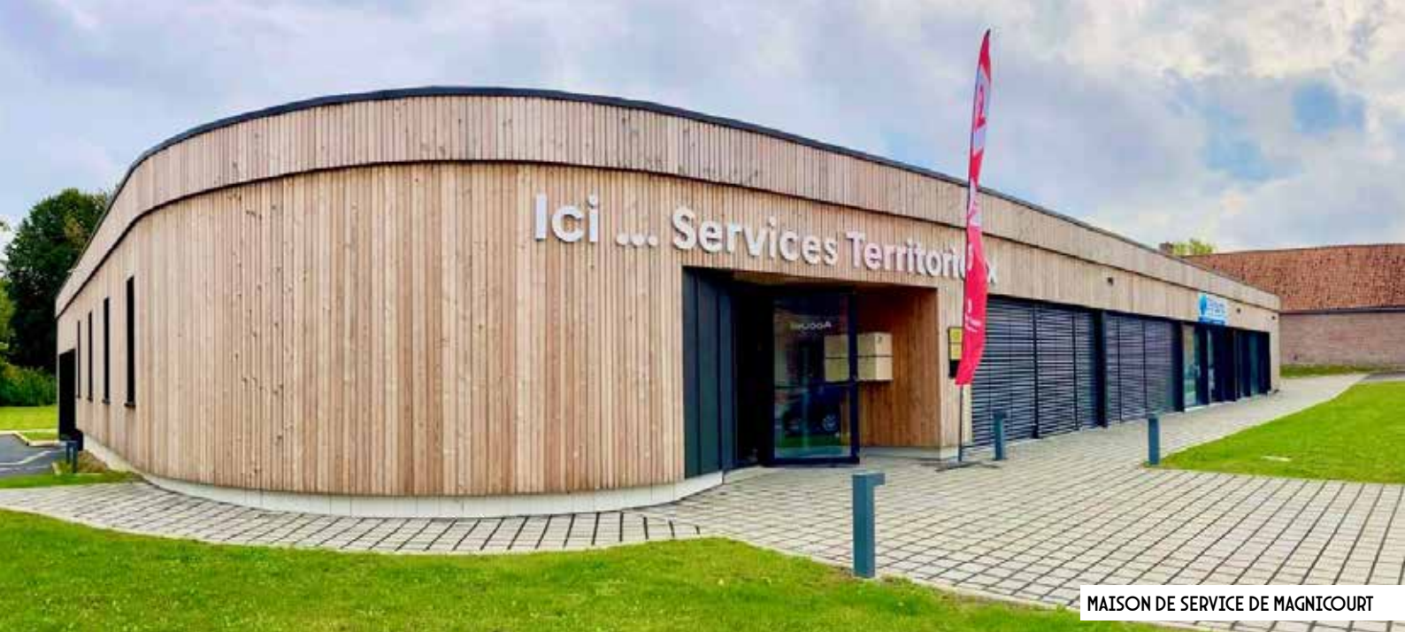
MAISON DE SERVICE DE MAGNICOURT