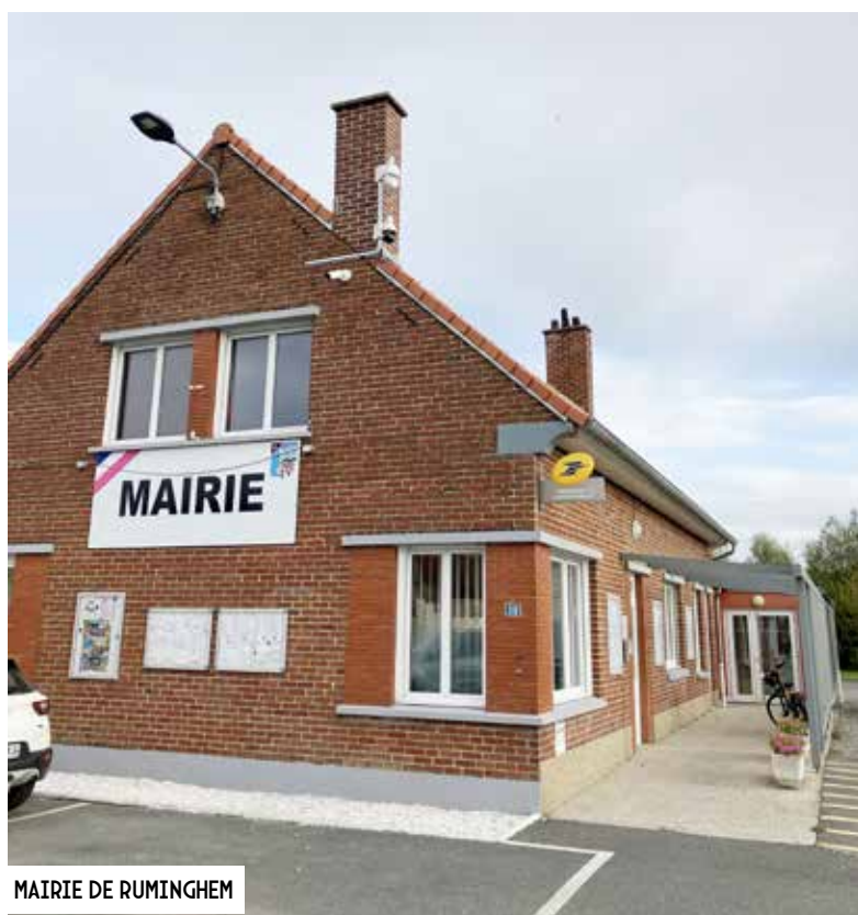
MAIRIE DE RUMINGHEM