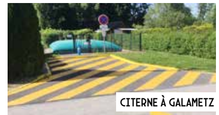
CITERNE À GALAMETZ