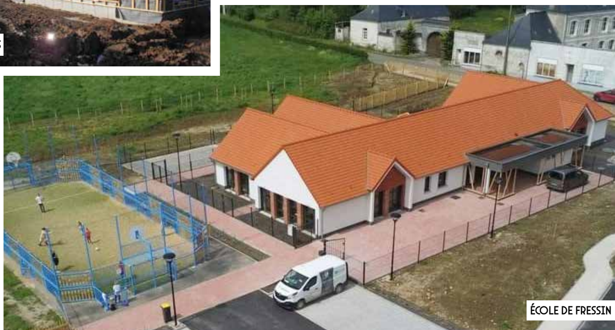
ÉCOLE DE FRESSIN