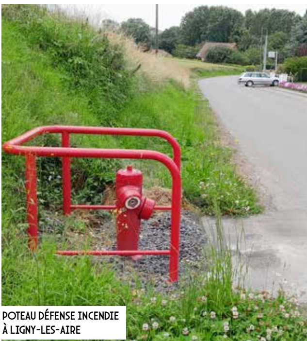
POTEAU DÉFENSE INCENDIE À LIGNY-LES-AIRE