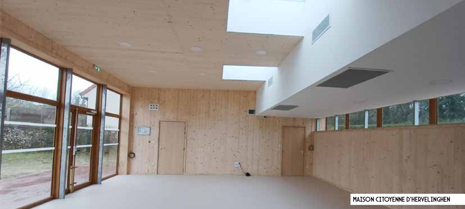
MAISON CITOYENNE D'HERVELINGHEN