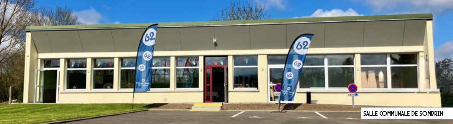
SALLE COMMUNALE DE SOMBRIN