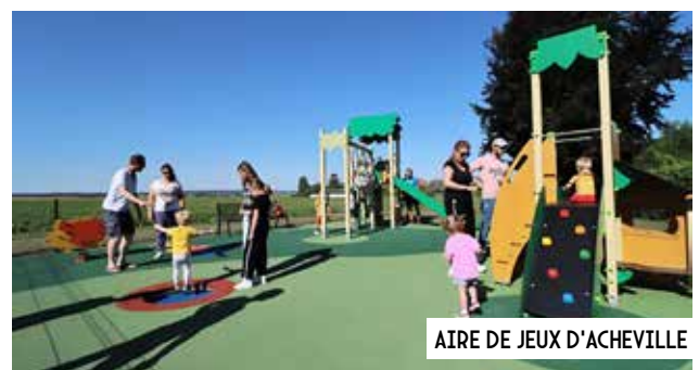
AIRE DE JEUX D'ACHEVILLE

- petits équipements sportifs , ex : parcours sportifs, boulodrome, petits matériels (buts, table de tennis de table fixe), sauf projets Espaces Sites et Itinéraires du plan départemental, et équipements d'animation locale ;