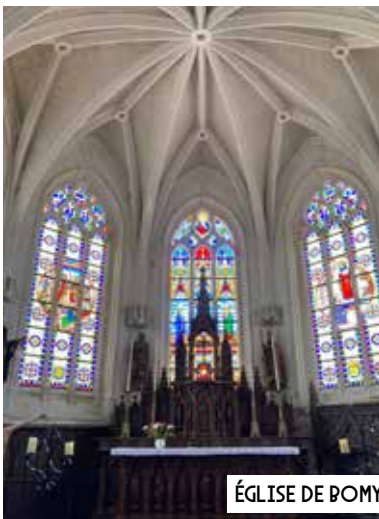
ÉGLISE DE BOMY

Photos de l'édifice (vue générale, insertions paysagères).