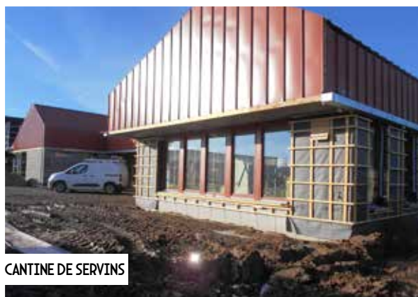
CANTINE DE SERVINS

La nature des travaux consiste à améliorer la qualité de service apportée aux publics.