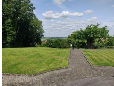
Mémorial Canadien de Bourslon