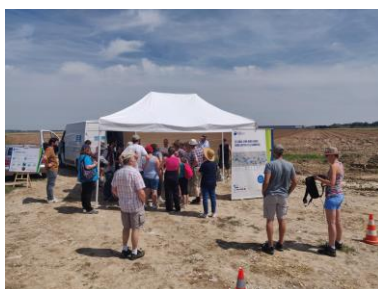
Chapiteau de départ Graincourt-lès-Havrincourt