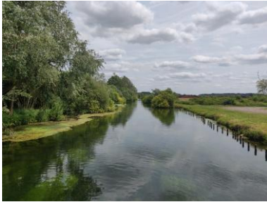
Marais de la Sensée

En amont des premières rencontres en communes et afin de préparer au mieux les différents diagnostics, des visites de terrain ont été effectuées par un architecte et un paysagiste du CAUE. L'objectif est de pré-identifier les enjeux du territoire et de s'imprégner des paysages et de l'environnement qui seront impactés par la construction du Canal Seine-Nord Europe.