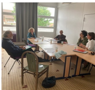
CCF à Boulogne-sur-mer le 17 mai 2025

Le second s’est tenu dans 5 villes dont 2 villes du Pas-de-Calais, Calais et Saint-Pol-sur-Ternoise . Avec au total sur les 2 villes, 4 porteurs de projet reçus et 11 cigaliers présents.