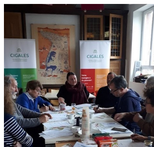
CCF à Saint-Pol-sur-Ternoise le 15 novembre 2025